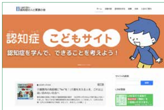
認知症の人と家族の会ホームページ

※上記のサイトが見つからない場合は、ホームページの「サイト内検索」で検索してください。