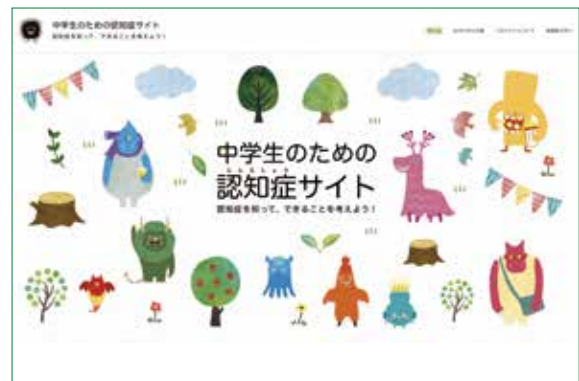
中学生のための認知症サイト